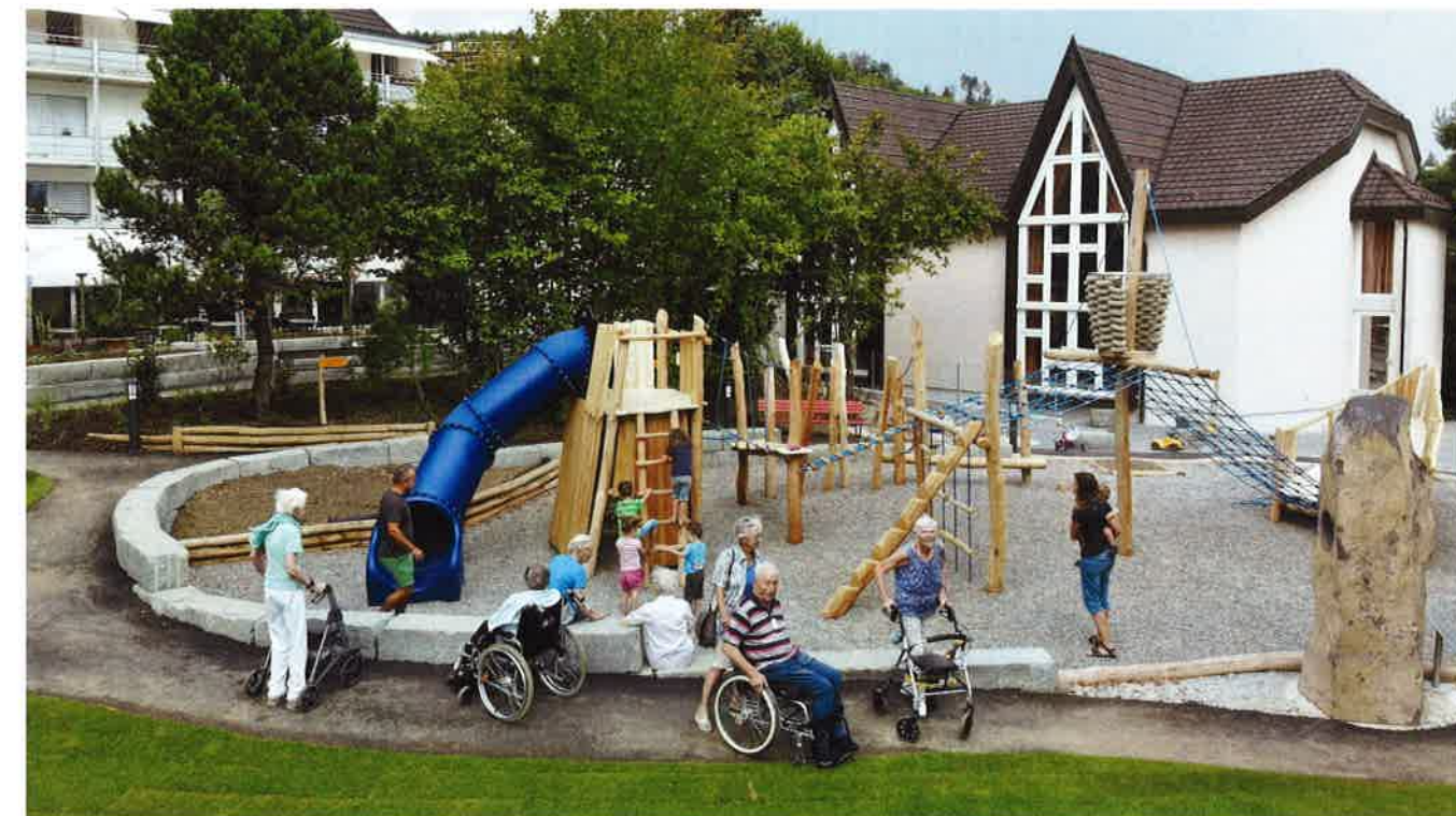
Begegnungsstätte für Jung und Alt mit vielfältigen Spiel- und Erholungsmöglichkeiten